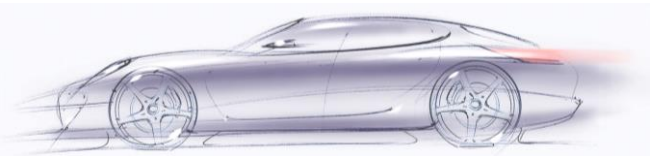
Laboratoarele Departamentului IMF si aplicații specifice de proiectare produs